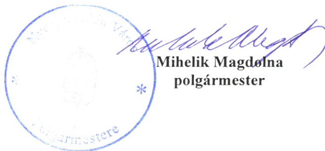
Mihelik Magdolna polgármester