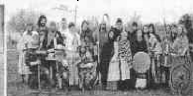
S.A.G.A. Európai Harcművészetek Iskolája